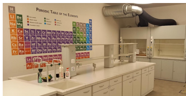
Obr. 1. Laboratoř chemie